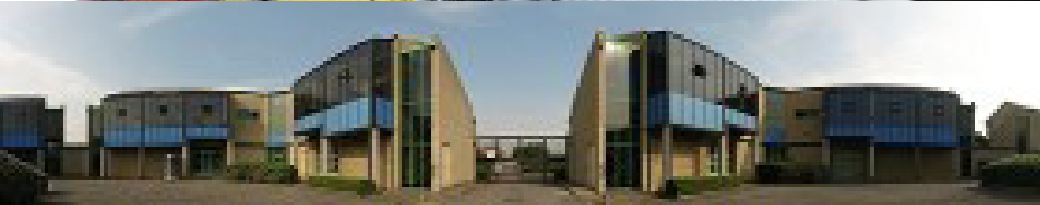
SHEFFIELD TECHNOLOGY PARKS