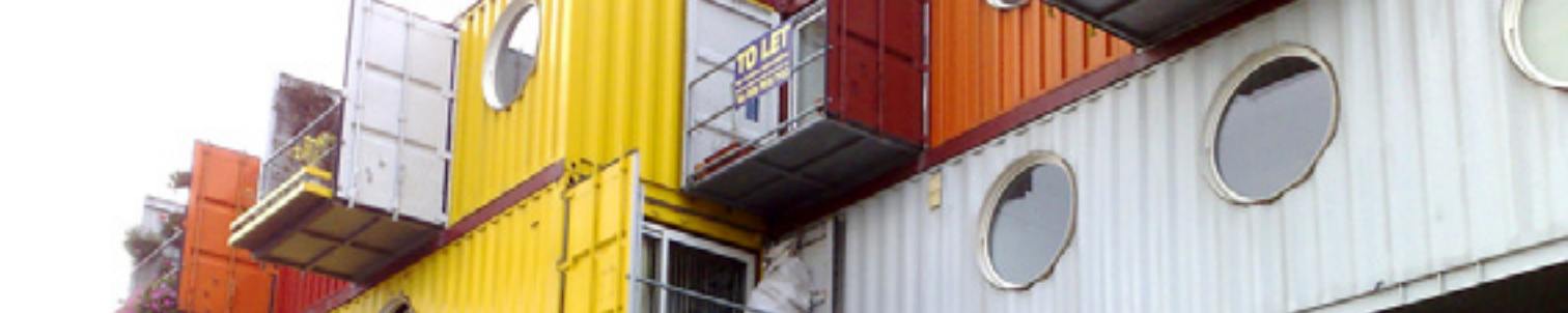
LONDON TRINITY BUOY WHARF