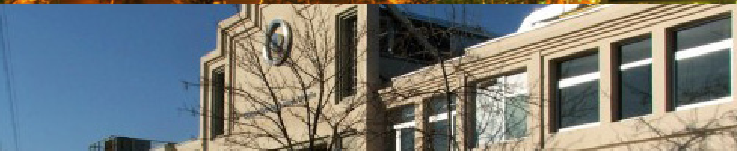
CENTRO METROPOLITANO DE DISEÑO